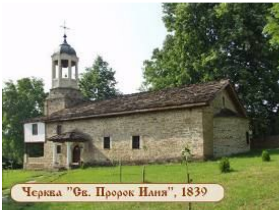
Църква "Св. Пророк Илия", 1839