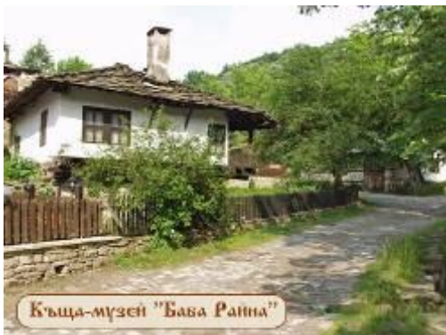
Къща-музей "Баба Райна"

Боженци е едно от най-запазените балкански селища у нас, съхранило ценни паметници на традиционното строително изкуство от края на XVIII в. до началото XXв. То е застроено по склоновете на подковообразна седловина, отворена на северозапад. Склоновете се спускат към най-ниската част на селището, където на пътя водещ към Габрово е оформен неговия централен площад.