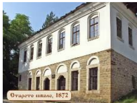
Старото школо, 1872